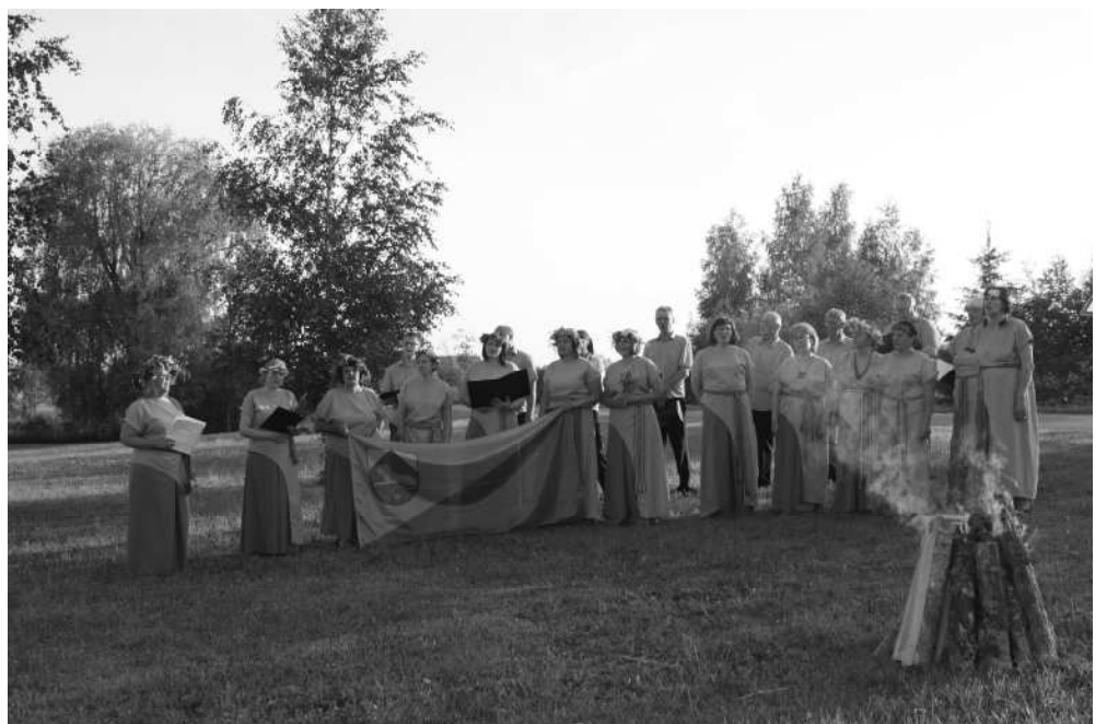
Par dziesmotu sveicienu skrējiena dalībniekiem gan pie Pīksāru baznīcas, gan pie Ķonu dzirnavām gādāja Naukšēnu kultūras nama sieviešu ansamblis “Noktirne” un vīriešu ansamblis “Klusie ūdeņi”