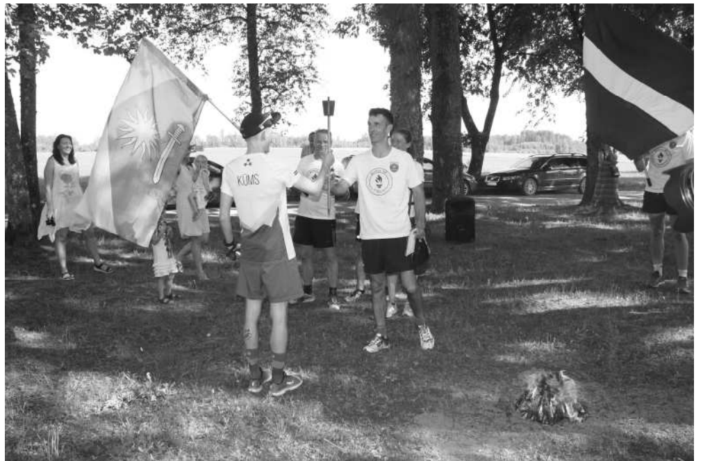
Lāpas nodošana starp skrējiena dalībniekiem pie Pīksāru baznīcas