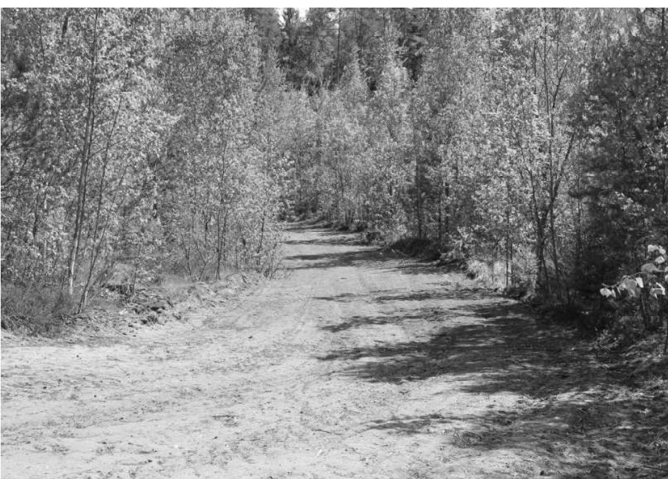
Brantiņu mežā izveidota pievilcīga pastaigu taka, kura ziemā kalpos kā slēpošanas trase